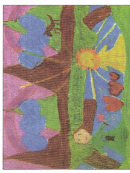
İlayda TÜYLÜOĞLU (7)